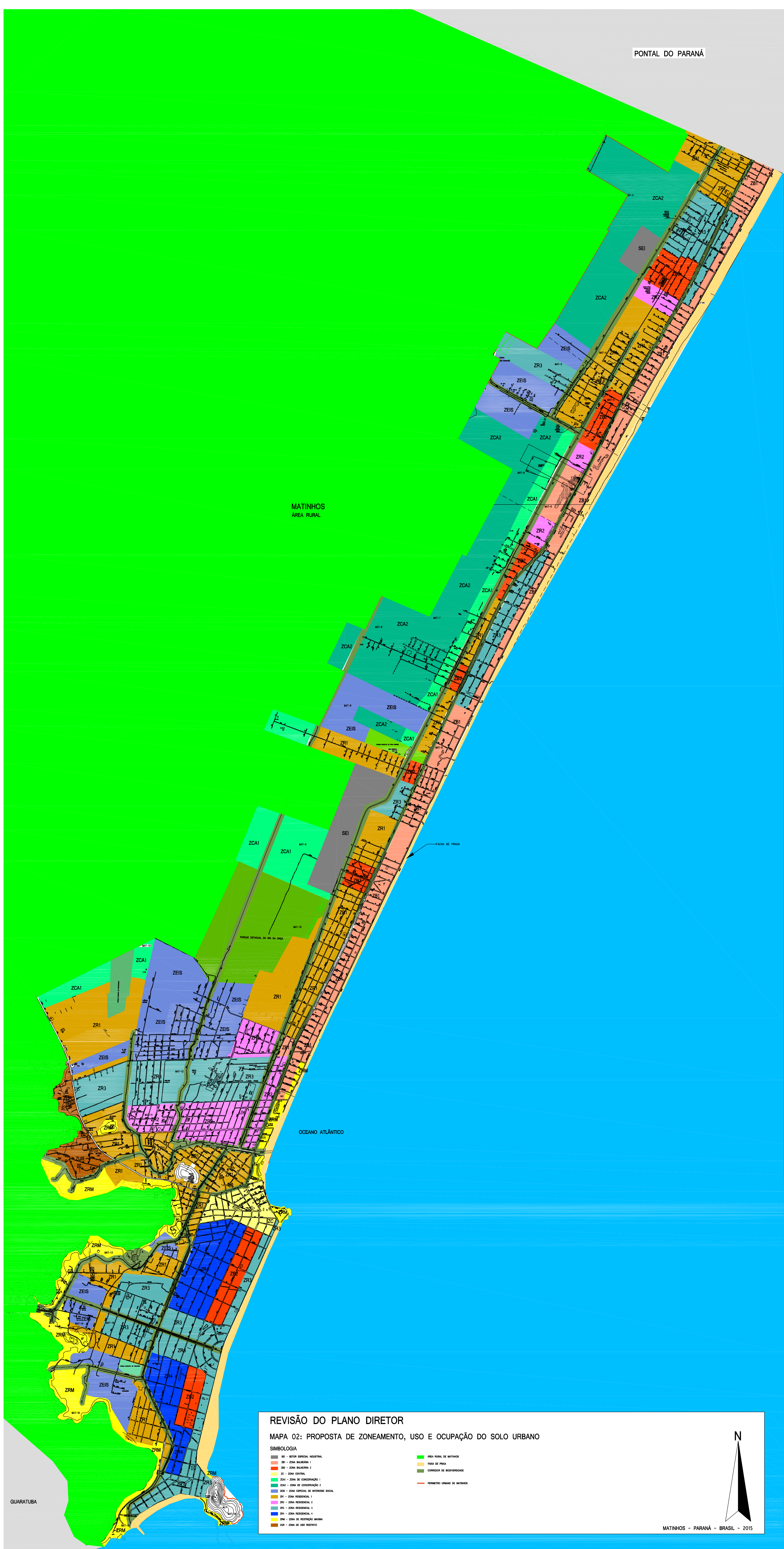
REVISÃO DO PLANO DIRETOR MAPA 02: PROPOSTA DE ZONEAMENTO, USO E OCUPAÇÃO DO SOLO URBANO