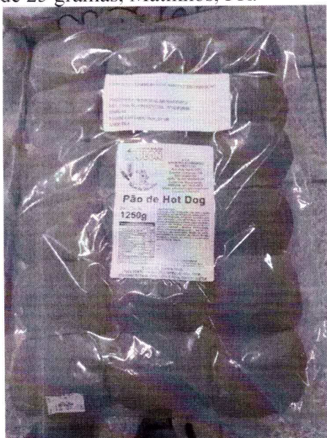
Figura 2: Pão de leite para Hot Dog, 1 pacote com 1250 gramas, contendo 50 unidades de 25 gramas, Matinhos, PR.