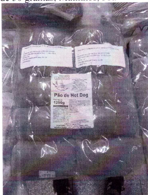
Figura 1: Pão de leite para Hot Dog, 1 pacote com 1250 gramas, contendo 25 unidades de 50 gramas, Matinhos, PR.

O registro da amostra realizado no dia da certificação do produto está representado na figura 2.