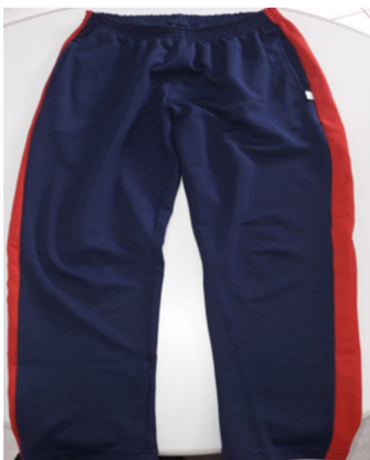
Ilustração do uniforme do professor