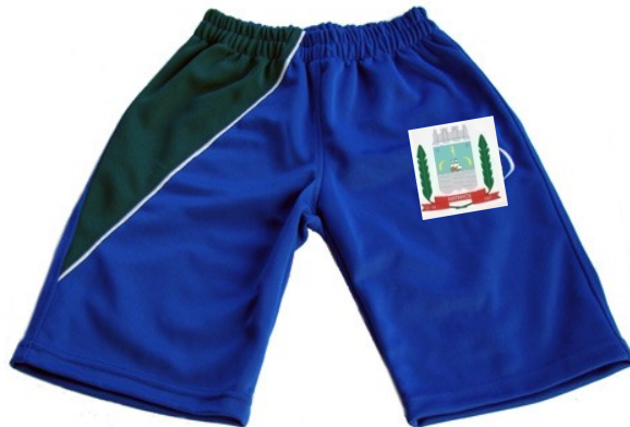
Imagem meramente ilustrativa)